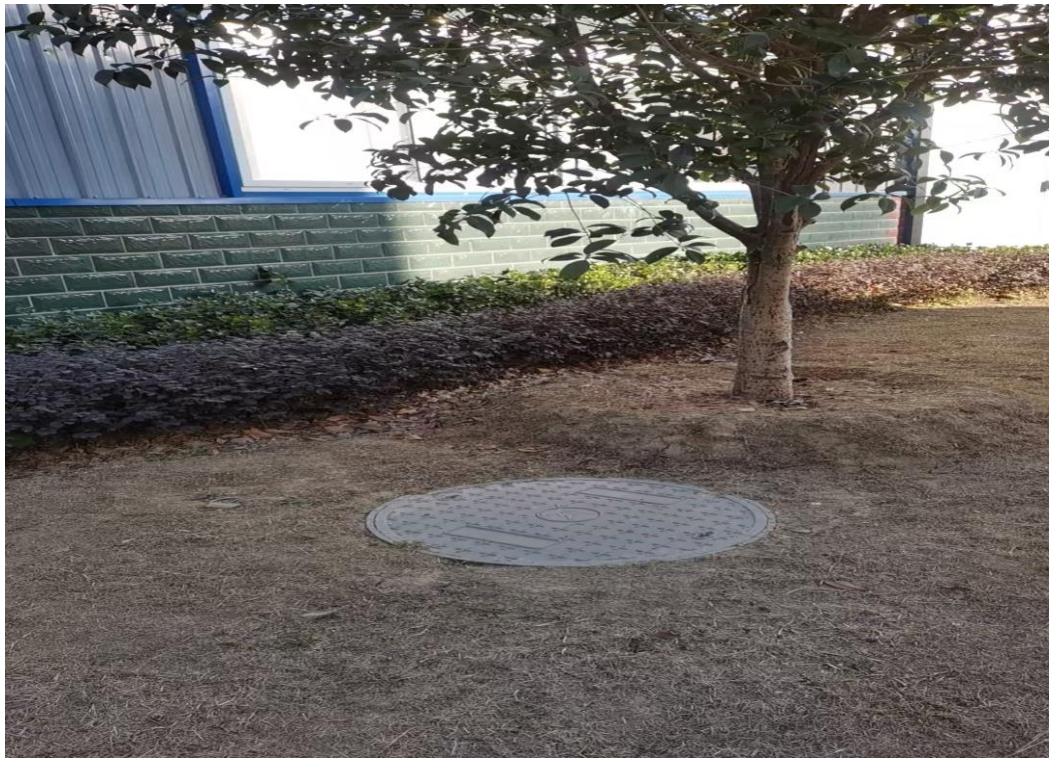
绿化（乔木和播撒草籽）