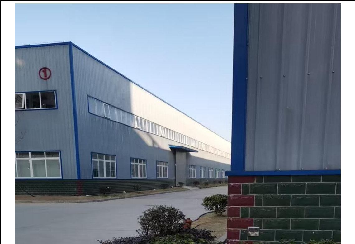
道路硬化 现场踏勘照片