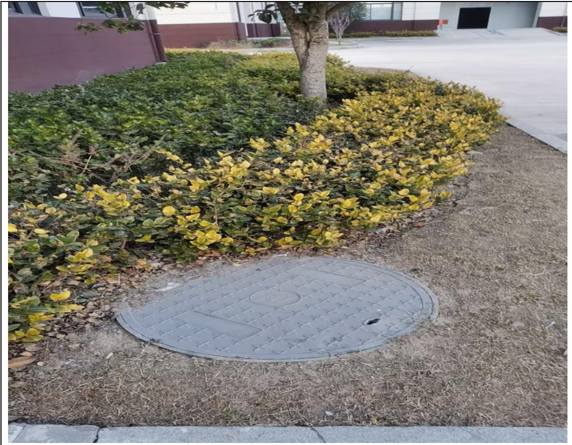
雨水井及雨水集水口